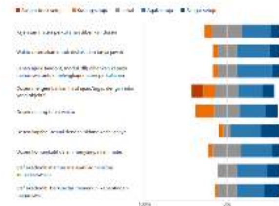
5. Aspek Reliability (ketepatan waktu dosen, dan mahasiswa) (10 point)

Perlu tindak lanjut dalam ketepatan waktu dosen dalam mengajar dan umpan balik pekerjaan mahasiswa baik dalam tugas dan ujian.